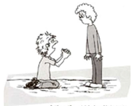
Snälla, snälla ... det är årsmöte i morgon och ingen annan vill ställa upp!

Bildtext: Snälla —snälla det är årsmöte i morgon och ingen vill ställa upp!